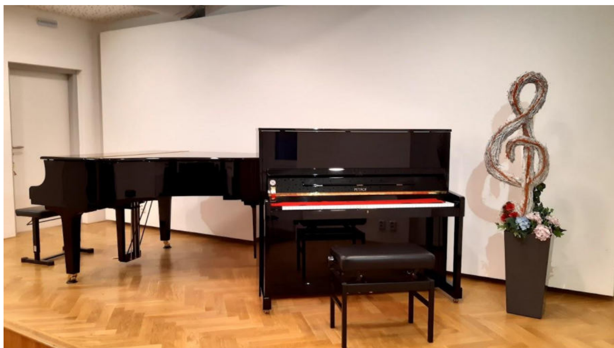
Dva klavíry v sálku ZUŠ již připravené pro natěšené žáky i vyučující